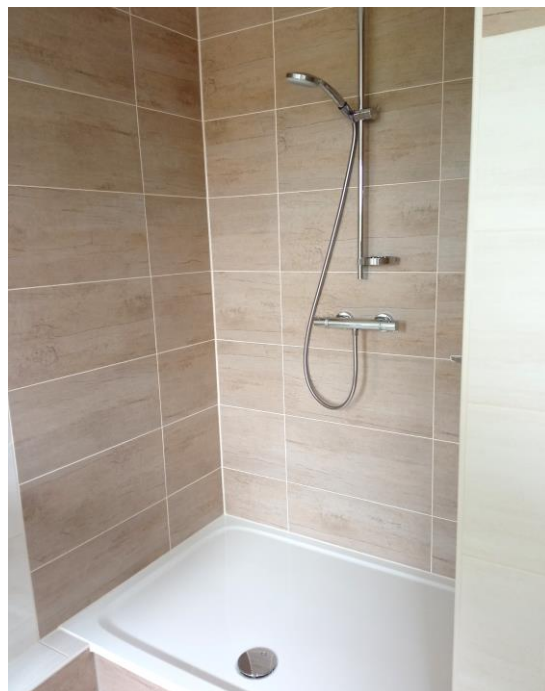
Bad mit Dusche