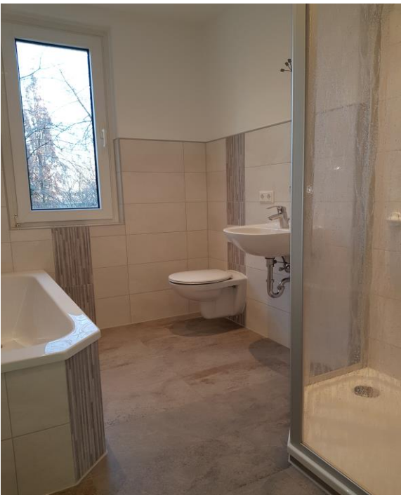
Tageslichtbad mit Wanne und Dusche