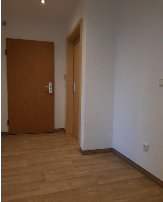
Flur mit Abstellkammer