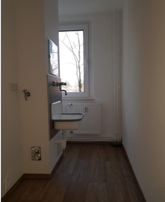
Hauswirtschaftsraum mit Anschluss für Waschmaschine