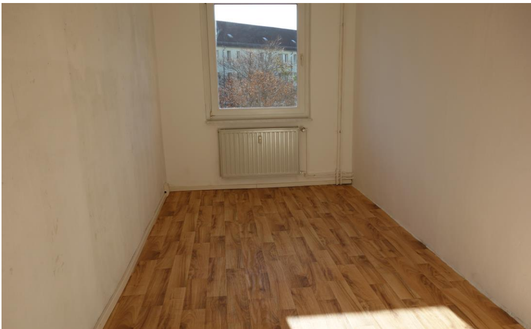
Kinder- oder Esszimmer