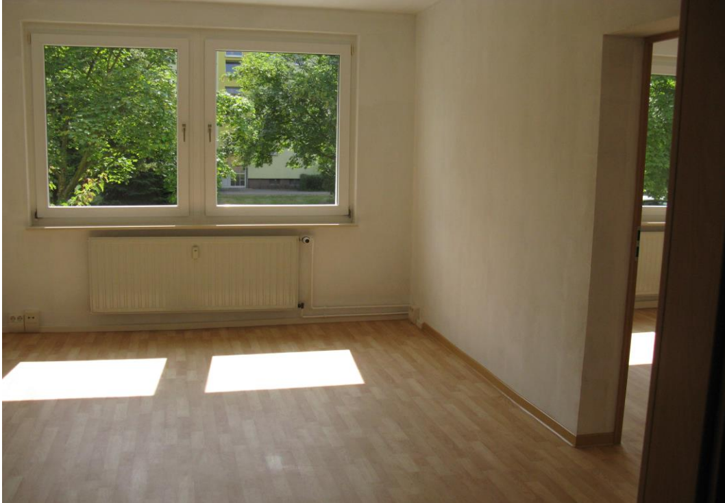
Wohn- und Schlafzimmer