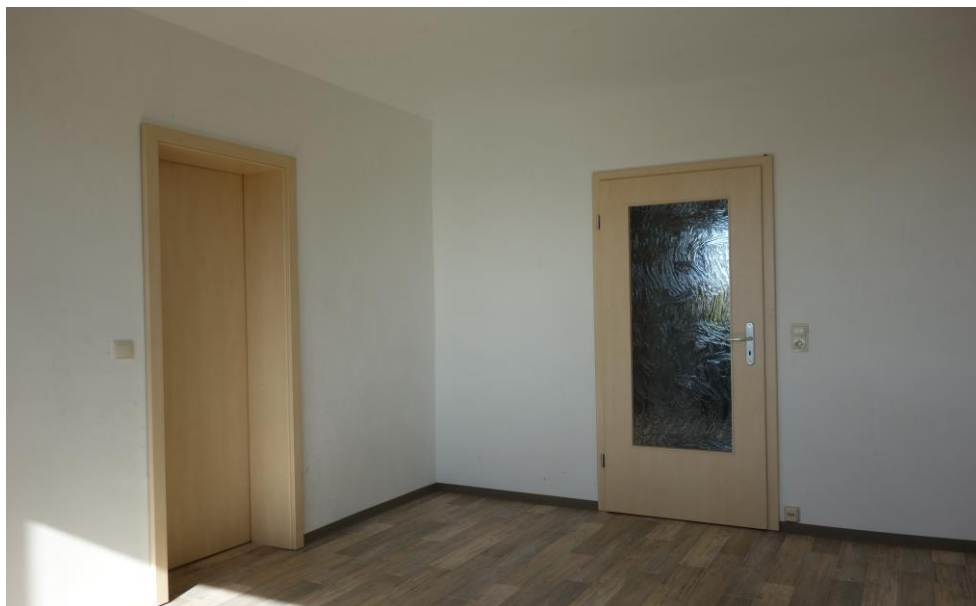
Wohnzimmer - Blick zum Schlafzimmer und zum Flur