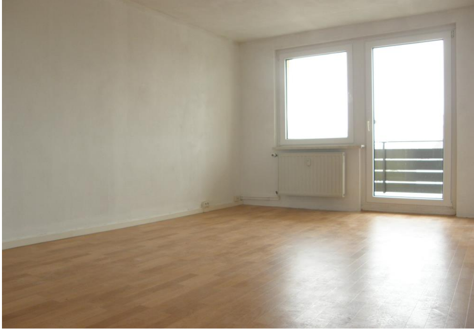
Wohnzimmer - Blick zum Balkon