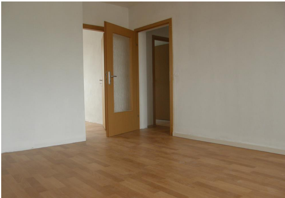
Wohnzimmer - Blick zum Schlafzimmer und zum Flur