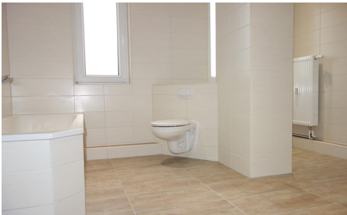
Tageslichtbad mit Dusche und Wanne