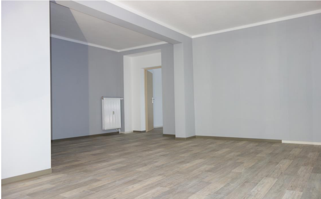
Großzügig geschnittenes Wohnzimmer mit angrenzendem Schlaf- oder Kinderzimmer