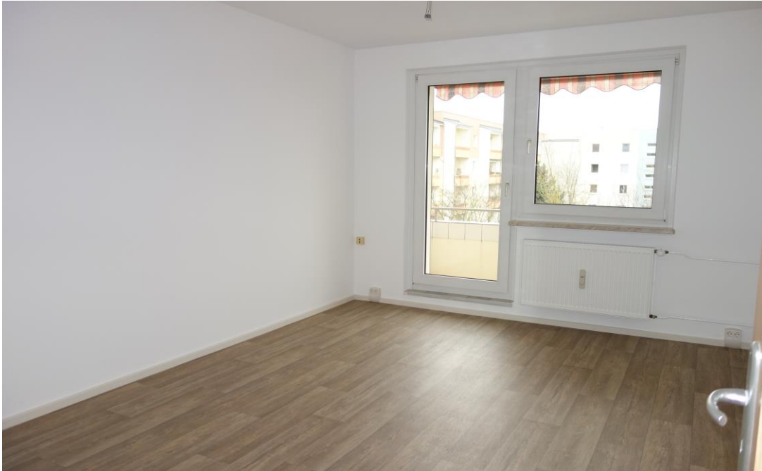
Blick ins Wohnzimmer