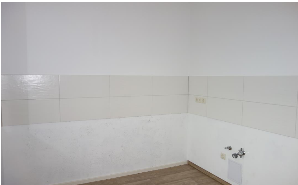
geflieste Küchenzeile - geräumige Essküche