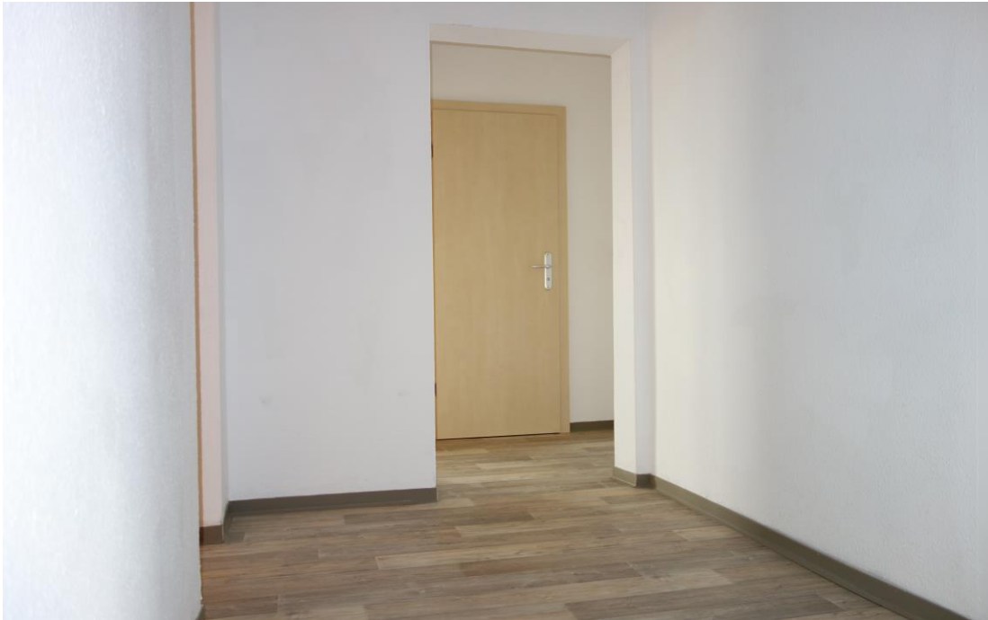
Blick durch den Flur.

Diese Wohnung wird zur Zeit komplett modernisiert.