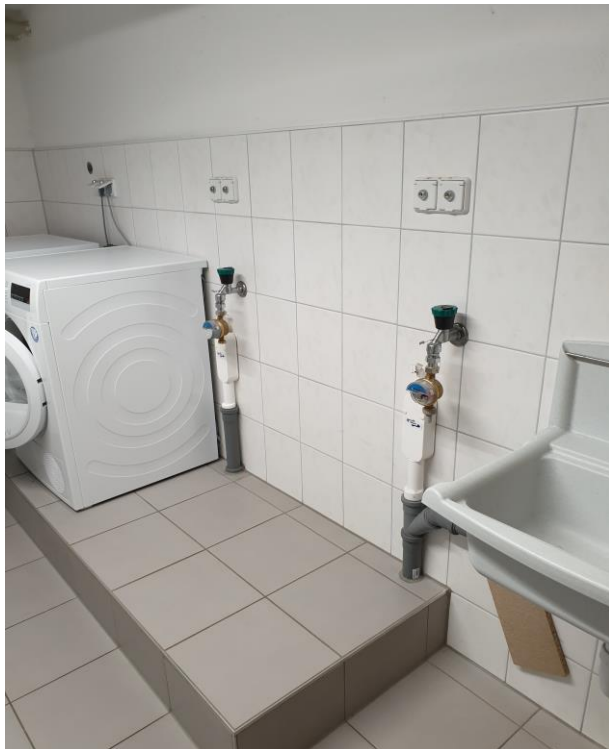
Waschmaschinenplatz im Gemeinschaftskeller